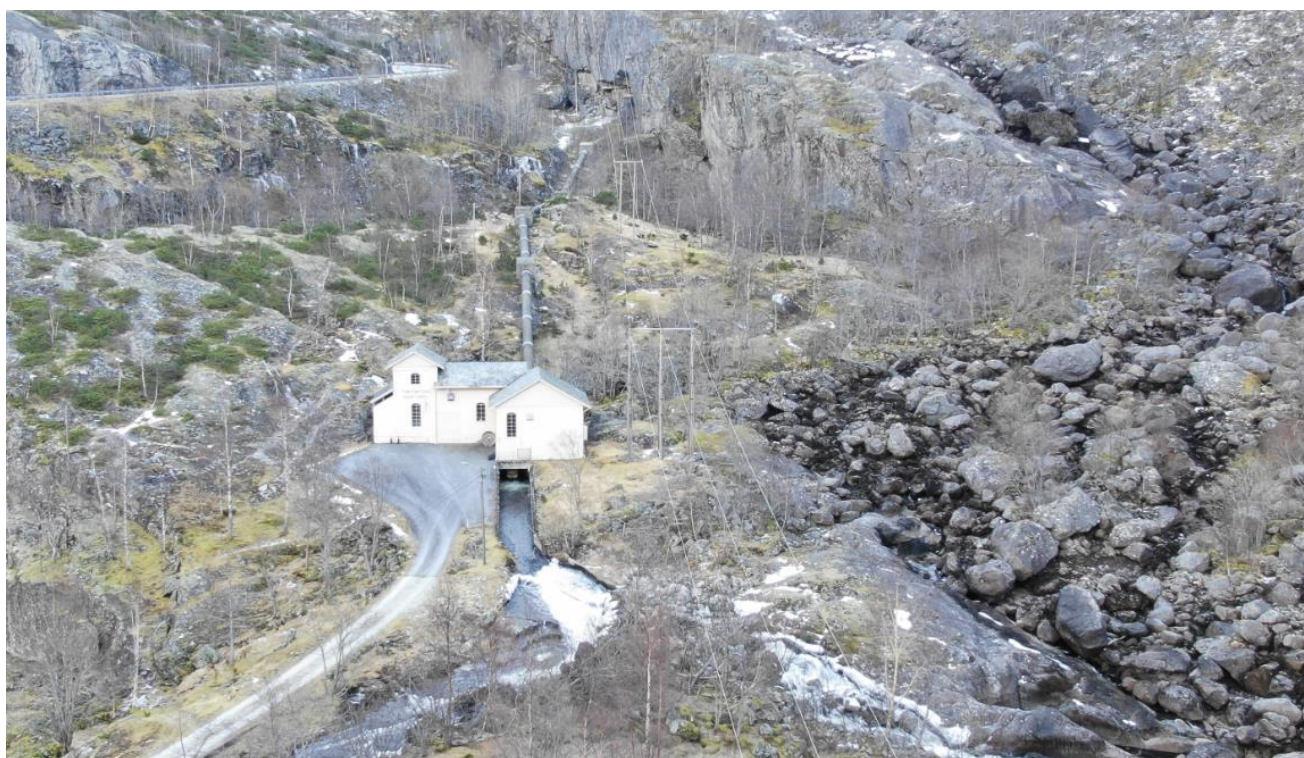
Biletet syner Tveitafoss Kraftstasjon. HE har fått konsesjon for å nær dubla produksjonen her.