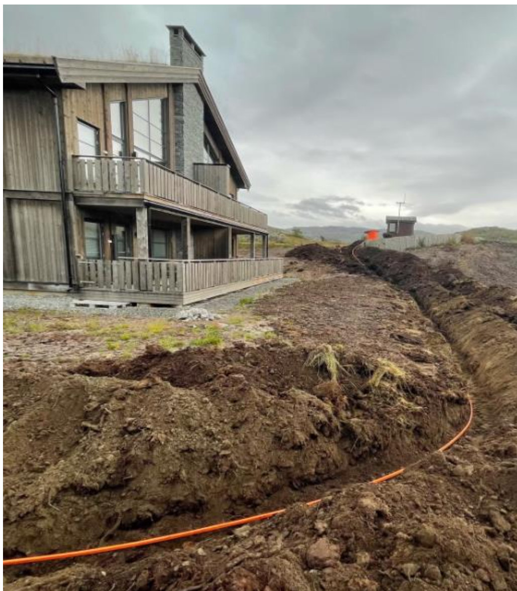
Fiberlegging i Sysendalen

Fyrste driftsår for HEB har vore prega av kraftig opptrapping av fiberinvesteringar. I 2023 er dei samlainvesteringane om lag dobla frå nivået i tidlegare Kinsarvik Breiband og Okapi. I 2024 er det lagt opp til ei ny dobling frå 2023-nivået.